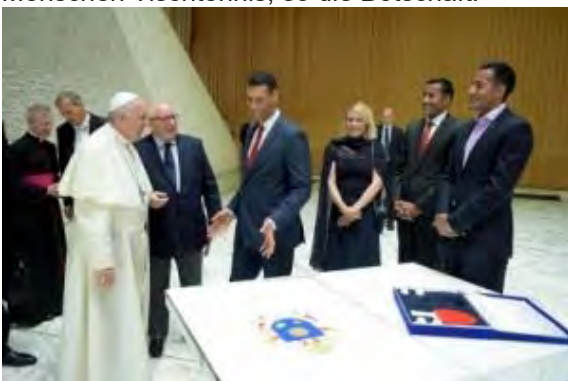
Endlich mal ein brauchbares Geschenk: Den Papst freut's